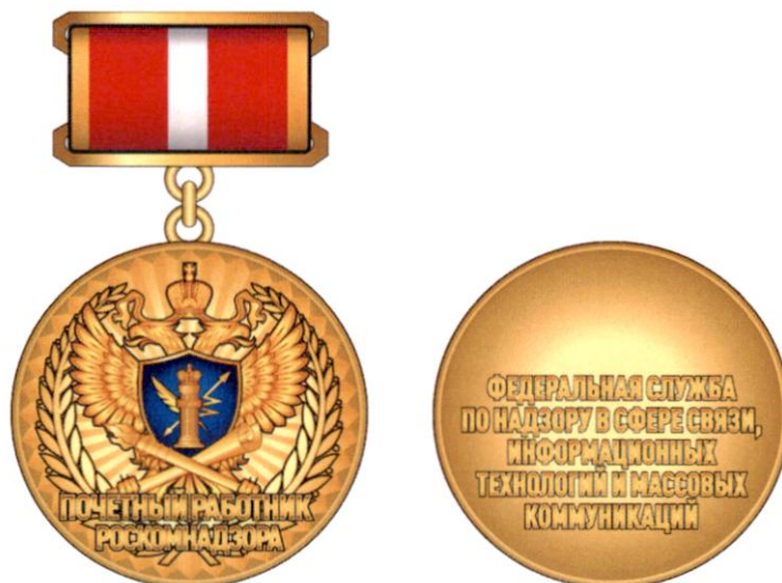
Рисунок нагрудного знака

Ширина ленты – 24 мм, ширина золотистой каймы – 2 мм.